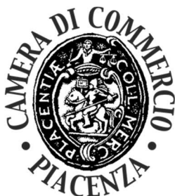
IMMAGINE LOGO SEDE DI PIACENZA:

Composizione ovoidale recante all'interno in senso circolare, le scritte in caratteri bodoniani maiuscoli Camera di Commercio – Parma e minuscoli: Industria, Artigianato, Agricoltura con al centro la raffigurazione di una ruota dentata sovrastata da una spigagermoglio.